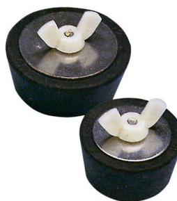
Čep za prezimovanje