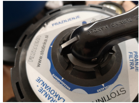
ventil v nevtralni poziciji

Iz peščenega filtra (posoda s peskom) je potrebno izpustiti vodo. V ta namen je na spodnjem delu posode izpust. Najbolje je, da izpust iz posode čez zimo pustite odprt (pazite, da ne izgubite pokrovčka). Ventil filtra naj bo v poziciji za prezimovanje (v nevtralni poziciji med dvema utoroma, tako da so vsi dovodi odprti).