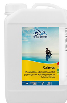
Sredstvo za prezimovanje

• Priprava strojnice: Črpalko filtra je treba demontirati, izprazniti, očistiti predfilter in črpalko shraniti na suho pred zmrzaljo zaščiteni mesto. Prav tako se demontira, očisti in shrani tudi črpalka za protitok, masažo..., v kolikor imate bazen opremljen s katero od teh naprav. Vso cevno inštalacijo bazena je treba izprazniti, vsi ventili razen talnega odtoka naj bodo odprti. Pri tem bodite pozorni na možnost odtekanja vode iz strojnice. V kolikor iz strojnice nimate odtoka vode je potrebno preprečiti, da bi v strojnico tekla voda v primeru, ko se nivo vode v bazenu čez zimo preveč dvigne. Čez zimo je običajno iz bazena potrebno dodatno spuščati odvečno vodo (dež, sneg), tako da je nivo vode vedno vsaj 10 cm pod najnižjo odprtino (povratna šoba, protitok...).